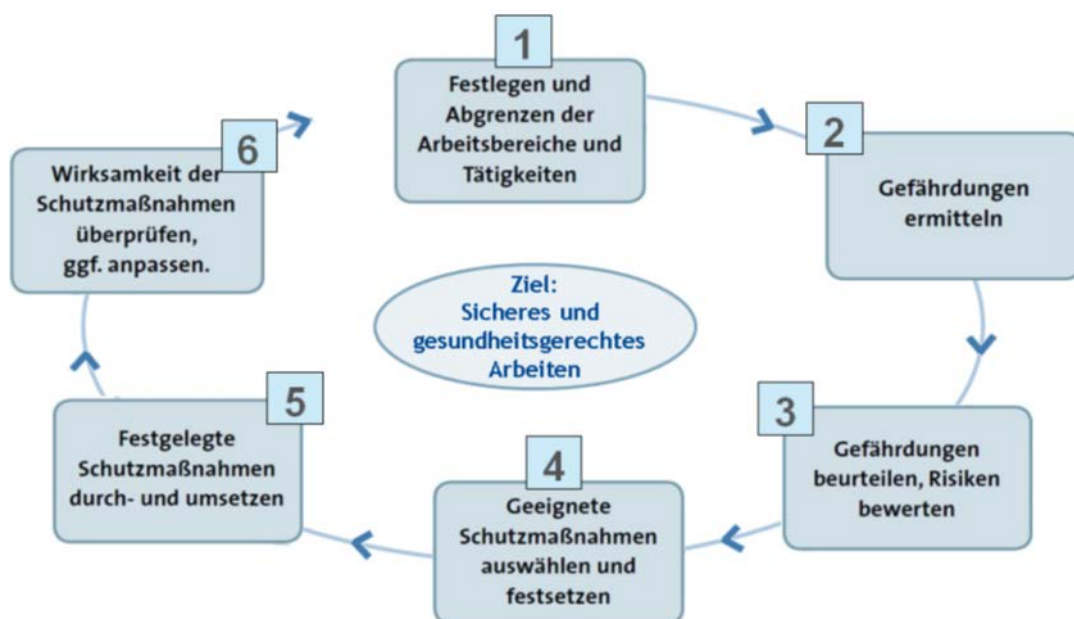
Handlungsschritte einer Gefährdungsbeurteilung

Die Gefährdungsbeurteilung ist eine Methode, Gefährdungen präventiv und systematisch zu ermitteln, zu bewerten, geeignete Schutzmaßnahmen festzulegen und deren Wirksamkeit zu überprüfen. Sie ist darüber hinaus eine Möglichkeit, um Arbeitsabläufe zu optimieren und Störungen im Betriebsablauf zu vermeiden.